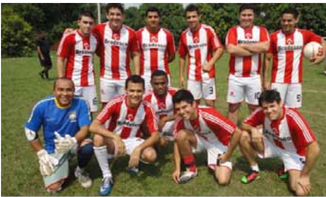
Bradesco Centro: campeão do Torneio Início Imperatriz.

O Torneio Início do II Campeonato Bancário de Futebol Society - Regional Imperatriz foi realizado no sábado (17/11).