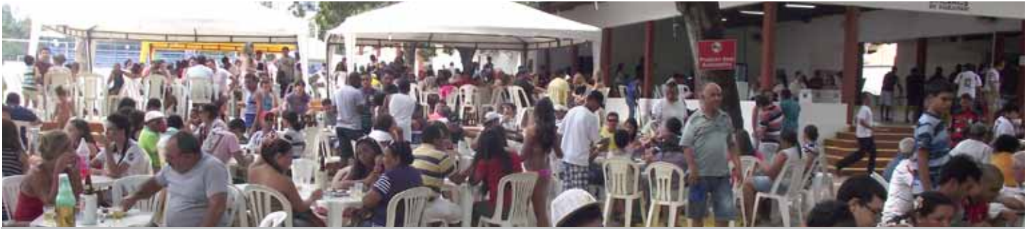
Na confraternização, além do tradicional churrasco e feijoada, haverá sorteio de brindes, dentre os quais, uma TV.

A diretoria do SEEB-MA convida todos os bancários para a Confraternização de Fim de Ano, que será realizada no próximo dia 08/12 (sábado) a partir das 9h, na sede recreativa do Sindicato, no Turu.