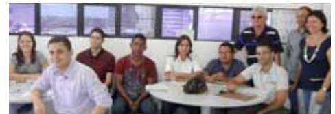
Recepção dos novos bancários da CEF.

Os professores municipais repudiaram a atitude da antiga gestão, demonstrando total apoio à chapa vencedora, encabeçada por Antonísio Furtado. O protesto durou o dia inteiro, na sede da entidade, na Cohab.