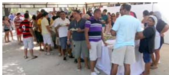
Além do churrasco, feijoada foi liberada!