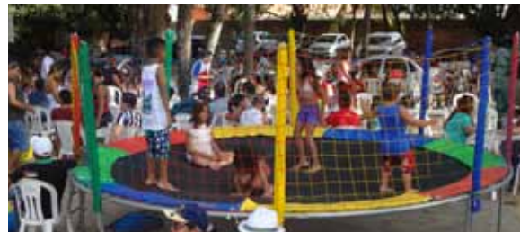
Pula-pula faz a festa da criançada.