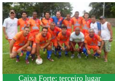
Caixa Forte: terceiro lugar