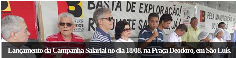
Lançamento da Campanha Salarial no dia 18/08, na Praça Deodoro, em São Luís.

O SEEB-MA lançou neste mês a Campanha Salarial 2014, no Maranhão. Foram realizados atos públicos em São Luís, Imperatriz, Caxias, Santa Inês e Bacabal.