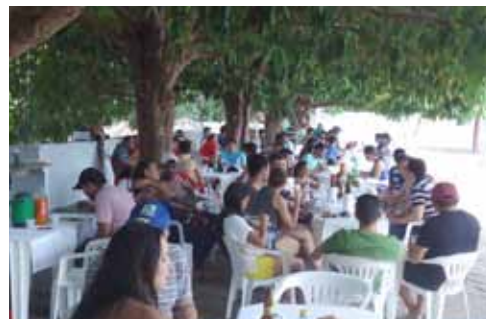
Em Imperatriz, categoria comemorou o Dia do Bancário com churrasco.

A Festa do Bancário foi um grande sucesso em São Luís e em Imperatriz! Na Capital, mais de 900 pessoas prestigiaram o evento, que marcou a reinauguração da sede recreativa da categoria, no Turu. A sede passou por uma grande reforma, com destaque para a ampliação e modernização do salão de festas, proporcionando mais conforto e comodidade aos bancários, que aprovaram a nova estrutura do local.