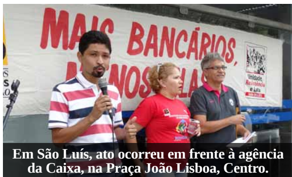
Em São Luís, ato ocorreu em frente à agência da Caixa, na Praça João Lisboa, Centro.

Na quinta-feira (11/09), Dia Nacional de Luta pela Isonomia, o SEEB-MA realizou ato público em prol da igualdade de direitos entre os empregados dos bancos federais. Em São Luís, a manifestação ocorreu em frente à Caixa Gonçalves Dias, na Praça João Lisboa, Centro.