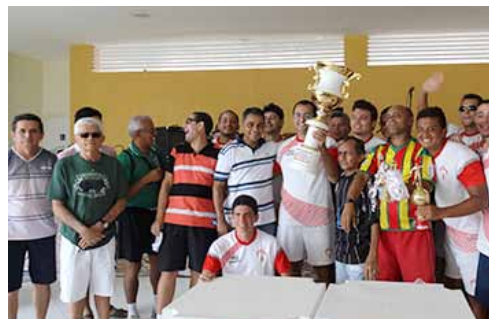
Bradesco Completo, bicampeão do Torneio Início de São Luís.