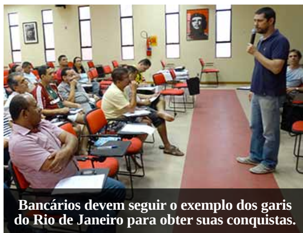
Bancários devem seguir o exemplo dos garis do Rio de Janeiro para obter suas conquistas.

Para os palestrantes, estes exemplos devem ser seguidos pelos trabalhadores em geral nas campanhas salariais que estão em curso.