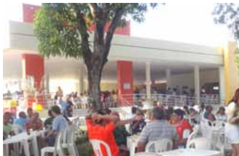
Em São Luís, houve a reinauguração da Sede Recreativa dos Bancários.