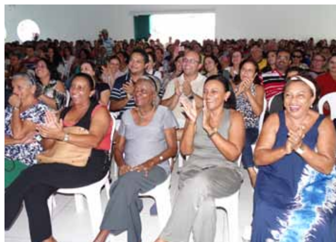
Mais de 500 pessoas se divertiram com a peça de maior sucesso da atualidade no Maranhão.