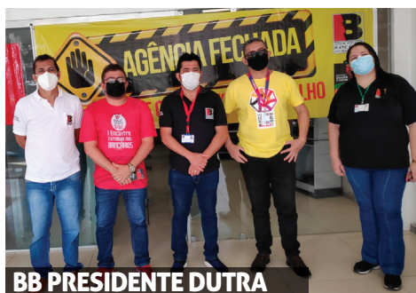
BB PRESIDENTE DUTRA

Após a reunião com o SEEB-MA realizada na sexta-feira (25/02), via Zoom, o BB informou que o setor jurídico do banco já autorizou a licitação emergencial para a contratação das novas empresas que serão responsáveis pelas reformas das agências Presidente Dutra e Bacabal, no interior do Estado.