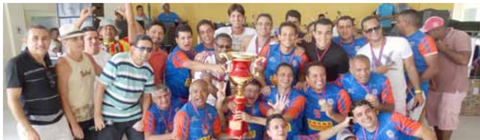
Diretores entregam a taça de campeão ao time da Caixa Forte, em São Luís.