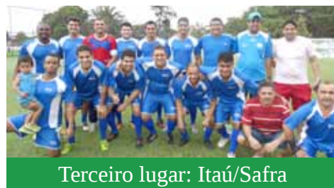
Terceiro lugar: Itaú/Safra