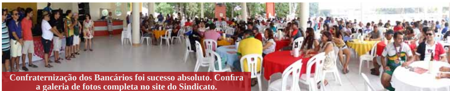
Confraternização dos Bancários foi sucesso absoluto. Confira a galeria de fotos completa no site do Sindicato.

A Confraternização de Fim de Ano, realizada no dia 13/12, foi um grande sucesso. Na ocasião, bancários e familiares se divertiram muito ao som do sertanejo universitário de Jhonatan e Jardel e do pagode Simplicidade. A ampliação e modernização do salão de festas da sede recreativa, reinaugurada no dia 13/09, proporcionou conforto a todos os presentes, que aprovaram a nova estrutura. Na festa, foi sorteada, ainda, uma TV LED 32", dentre outros brindes.