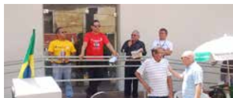
AGOSTO Bancários lançam Campanha Salarial em Caxias