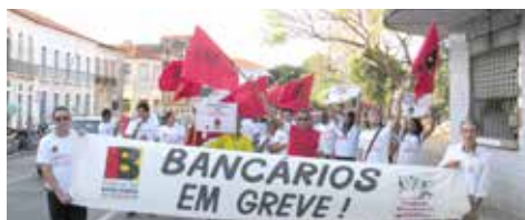
SETEMBRO Bancários em greve fazem passeata