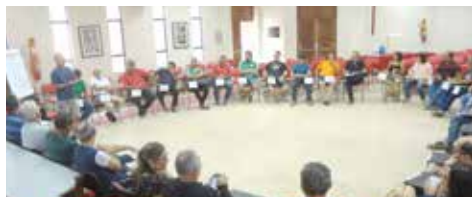
FEVEREIRO Reunião do Conselho de Delegados Sindicais