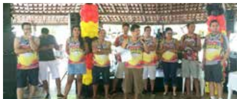
JANEIRO Festa do Bancário - Regional Imperatriz