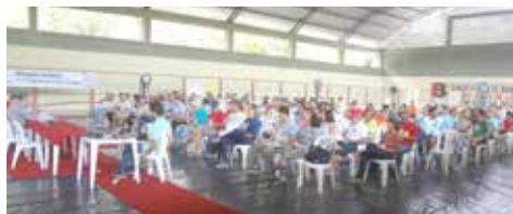
JANEIRO I Encontro Estadual 2016