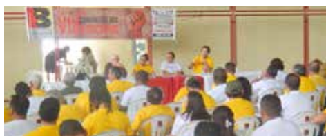
JUNHO Congresso Estadual dos Bancários