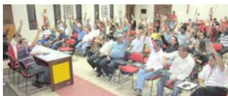
SETEMBRO Bancários decidem entrar em greve