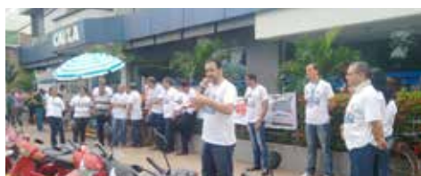
ABRIL Ato, em ITZ, pela Caixa 100% Pública