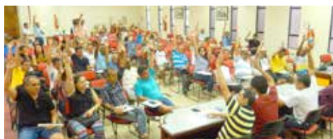
NOVEMBRO Orçamento 2017 é aprovado por unanimidade