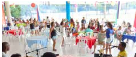
FEVEREIRO Baile de Carnaval dos Bancários