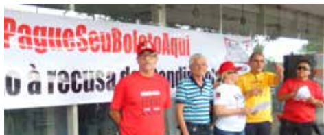
MARÇO Campanha contra a recusa de atendimento