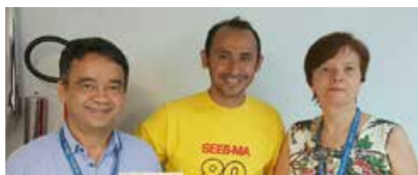
NOVEMBRO Pagamento da Ação dos Deltas da CEF