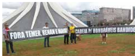
DEZEMBRO Protesto contra as reformas nefastas de Temer