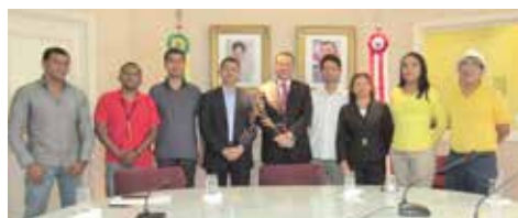
AGOSTO SEEB cobra do Governo segurança bancária