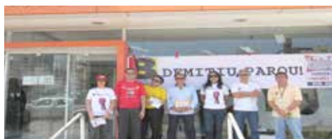
AGOSTO Ato contra as demissões no Itaú