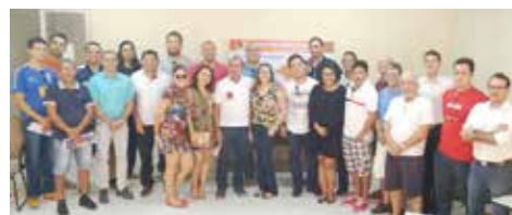
MAIO Encontro Regional em Pedreiras