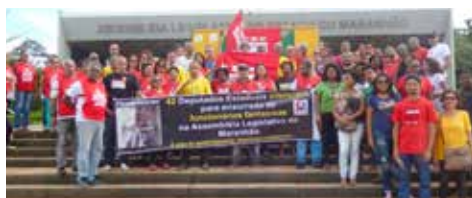
ABRIL Ato contra as mentiras dos políticos