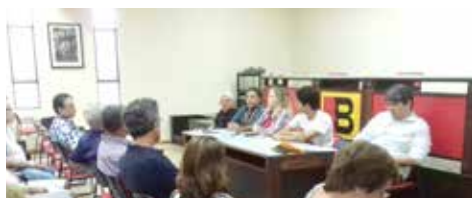
AGOSTO Pagamento da Ação de LP do BNB