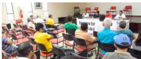
MAIO Encontro Estadual dos Bancos Públicos