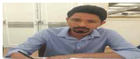
OUTUBRO SEEB-MA assina CCT com a Fenaban