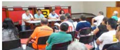
MARÇO Assembleia de prestação de contas