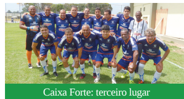
Caixa Forte: terceiro lugar