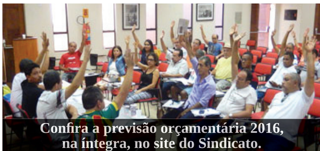
Confira a previsão orçamentária 2016, na íntegra, no site do Sindicato.

Os bancários aprovaram, por unanimidade, a previsão orçamentária do SEEB-MA para o ano de 2016, em assembleia realizada no dia 28/11, na sede do Sindicato, em São Luís.