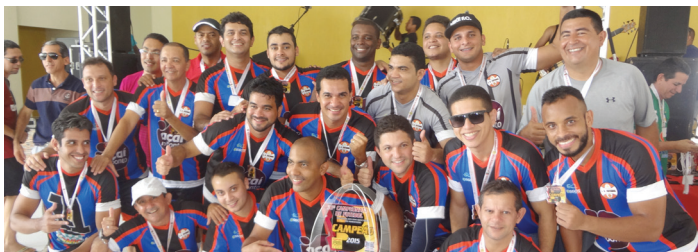
Time do Itaú/Safra comemora o título de campeão!