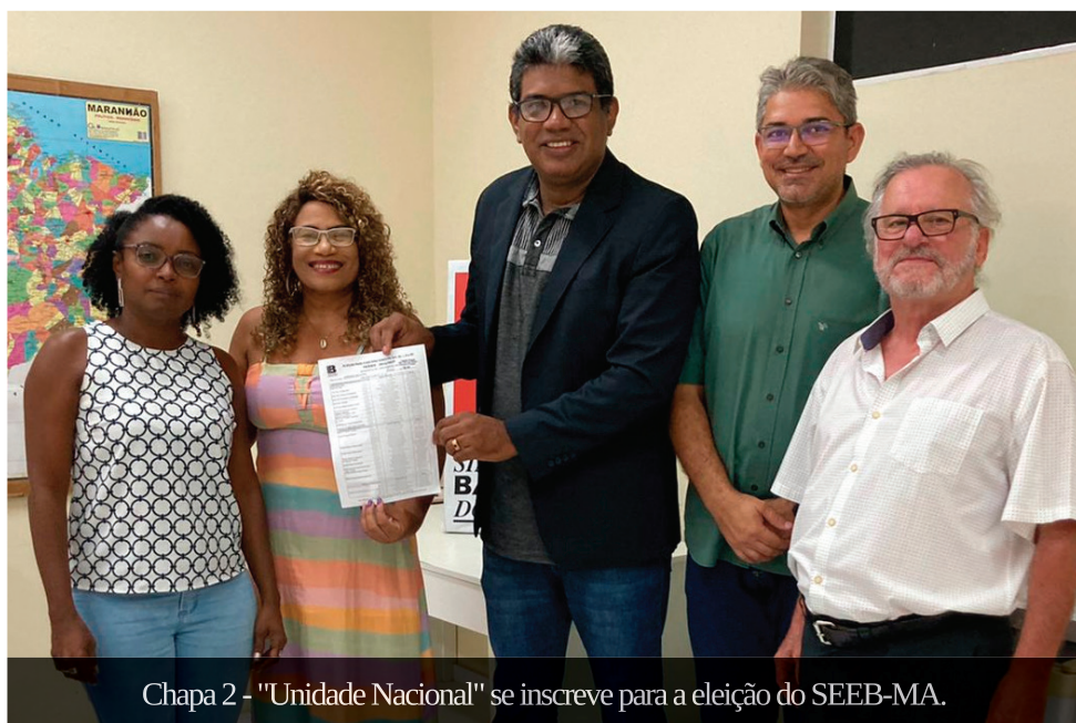
Chapa 2 - "Unidade Nacional" se inscreve para a eleição do SEEB-MA.