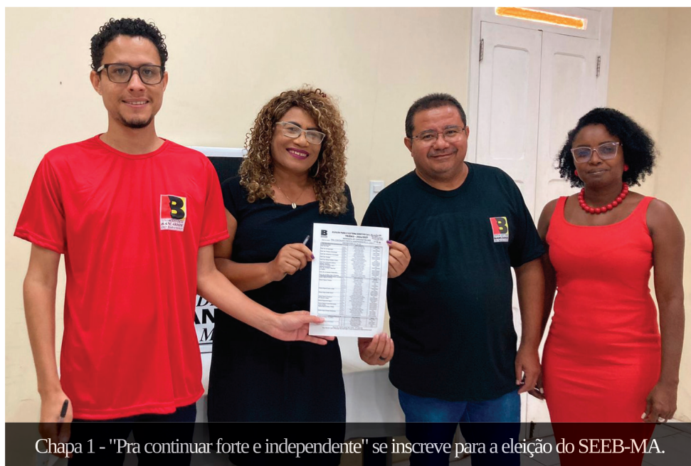
Chapa 1 - "Pra continuar forte e independente" se inscreve para a eleição do SEEB-MA.