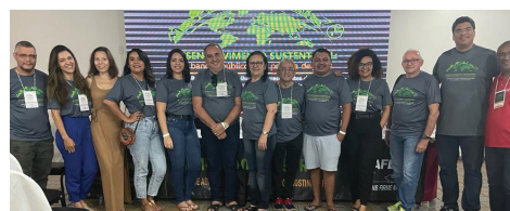
SEEB-MA NA 59ª REUNIÃO DA AFBNB