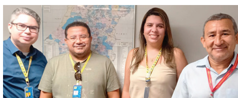
SEEB-MA E BB DIALOGAM SOBRE SAÚDE