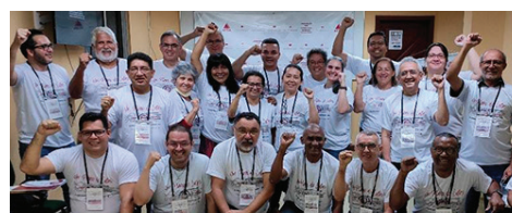
SEEB-MA NO PLANEJAMENTO DA AEBB

a cinquenta por cento do passivo atuarial da CAPAF. O tribunal condenou as partes também em honorários advocatícios de R$ 100 mil e custas de R$ 28,9 milhões, sendo estas últimas limitadas a quatro vezes o teto do regime geral de previdência social, que equivale atualmente a R$ 30 mil. O referido acórdão será impugnado pelo SEEB-MA por meio de embargos de declaração perante o próprio TRT-16, pedindo esclarecimento de alguns pontos da decisão e, posteriormente, pela via de Recurso Ordinário dirigido ao Tribunal Superior do Trabalho (TST). Como a decisão do Tribunal na ação rescisória substituiu a liminar anterior, que suspendia a execução do processo original, o SEEB-MA já solicitou que o Banco seja intimado a repassar à CAPAF o valor atualizado da parcela de responsabilidade que lhe cabe pelo déficit atuarial.